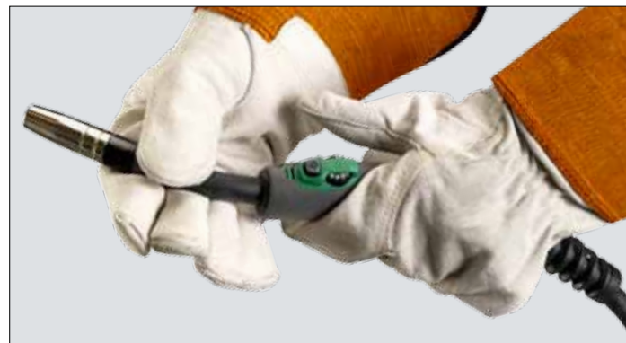
Ръкохватката на бренера с 360-градусово извиване на гърлото